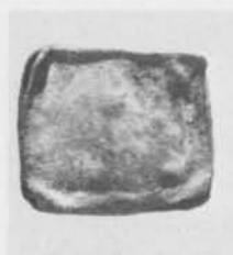
Fig. 1. Blybleck med runinskrift funnet vid Västannor, Leksands sn. Blecket i hopvikt skick. Foto G. Hildebrand 1980 (ATA). — Sheet lead with inscribed runes found at Västannor, Leksand parish, Dalarna. The sheet lead folded up.

Huvuddelen av inskriften består alltså av den kända bönen Ave Maria , här i en lydelse som svarar mot en tidig form av bönen (ängeln Gabriels hälsning till Maria i Luk. 1:28 och Elisabeths hyllningsord till Maria i Luk. 1:42) samt av de kända formlerna