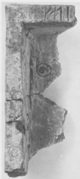
Fig. 5. Fragment av tegelföremål med runinskrift funnet på Helgeandsholmen i Stockholm. — Unidentified object of burnt clay found at Helgeandsholmen, Stockholm.

Fragmentet påträffades i två delar och förefaller vara rester av ett trågliknande kärl. Det är i sammansatt skick 28 cm långt och