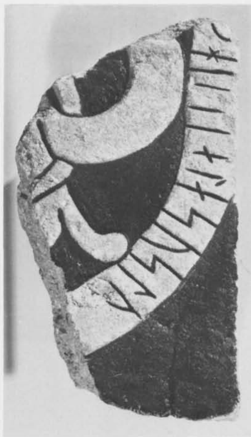
Fig. 3. Runstensfragment från Gudings, Alva sn, Gotland. Foto G. Hildebrand 1980 (ATA. — Rune-stone fragment from Gudings, Alva parish, Gotland.

gick mellan gårdens västra lada och mangårdsbyggnadens sydvästra hörn. Fyndet gjordes framför dörrarna till en lada som ligger mellan de andra byggnaderna. Området närmast omkring fyndplatsen undersöktes utan resultat. Det visade sig vara ett ca 30 cm tjockt sentida kulturlager (med bl. a. moderna spikar) ovanpå sand, vilket tyder på att fragmentets fyndplats var sekundär.