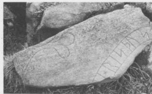
Fig. 8. Runstensfragment vid Venevalla, Remmene sn, Västergötland. Foto H. Gustavson 1980 (ATA). — Rune-stone fragment at Venevalla, Remmene parish, Västergötland.