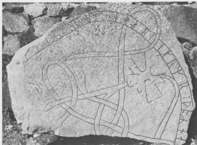
Fig. 6. Det återfunna runstensfragmentet U 1077 från Bälunge kyrka, Uppland. — The rediscovered rune-stone fragment U 1077 at Bälunge church, Uppland.

Materialet är svartspräcklig medelkornig granit och, i ett mindre parti av fragmentet, mörkare finkornig granit. Mått: 147×80 cm,