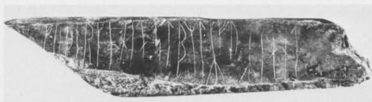
Fig. 4. Bryne med runinskrift funnet vid Västers i Boge sn, Gotland. Foto G. Gådefors 1979 (RAGU) jämte ritning av Annica Boklund.—Whetstone with inscribed runes found at Västers, Boge parish, Gotland.