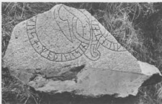
Fig. 7. Nyfunnet runstensfragment vid Risberga, Östuna sn, Uppland. — Recently found rune-stone fragment at Risberga, Östuna parish, Uppland.

Runföljden moþur sin avser ett runsvenskt moður sina "sin moder", med sin för ett väntat sina . Denna skrivning förekommer i en del vikingatida runinskrifter. Hur run-